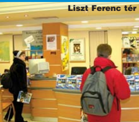
Liszt Ferenc tér